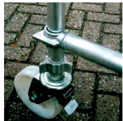
Výškovo nastaviteľné koleso s brzdou